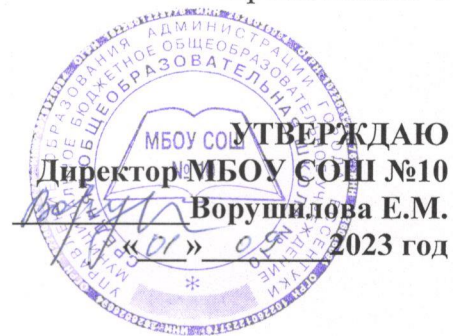
График Родительского контроля за организацией питания в школьной столовой В МБОУ СОШ № 10 2023-2024 учебный год.